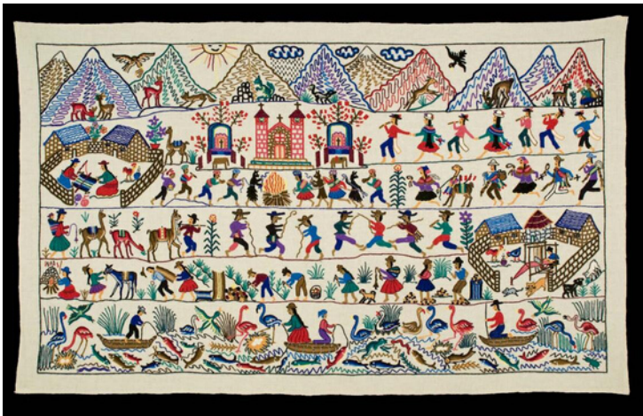
Village Scene, by Chijnay cooperative. Peru, South America. 2007. Museum Purchase with funds from the MNMF Folk Art committee, Museum of International Folk Art

In the Museum of International Folk Art, we have a special exhibit that looks at how communities across different continents told stories in difficult times. Each community used embroidery, quilting and applique to share what was hard, special, or important to them, or what they wanted to remember about their homes, families, and communities. We are going through difficult times today which often means staying in our homes. So, we want you to think about what you love about your house or home, or somewhere in your home, or a place that feels like home. How you can make that picture in fabric? You can sketch out your idea on paper and you can think about the different shapes that you will put together to make your picture.